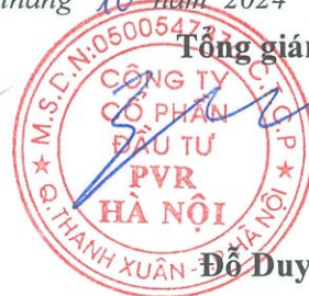
Đỗ Duy Điền